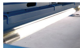
Iluminación 4 o 6 tubos LED