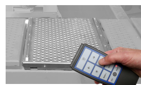
Detector de holguras con mando