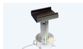
Adaptador de altura para U de 150-233 mm*