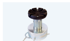
Adaptador de altura 155-245 mm*