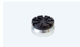
Adaptador de altura 44 mm*