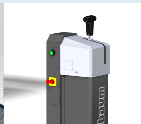
Construcción muy baja: Perfecto para vehículos deportivos